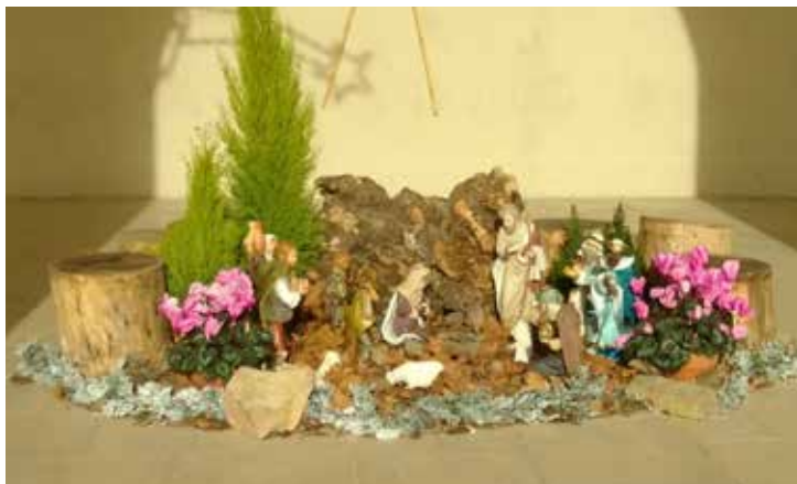
Il presepe allestito in largo G. Pastori, all'ingresso del teatro