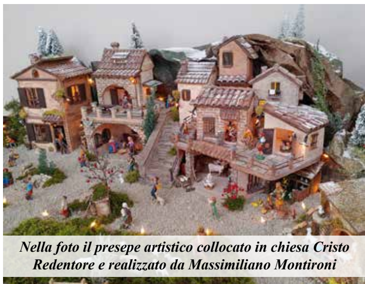
Nella foto il presepe artistico collocato in chiesa Cristo Redentore e realizzato da Massimiliano Montironi

Carissimi, con questa lettera augurale per il Santo Natale desidero esprimere, con semplicità, a voi tutti ciò che sento sia importante che avvenga per accogliere Gesù.