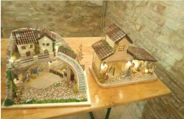
Nella foto presepi realizzati dai discenti del 3° del corso