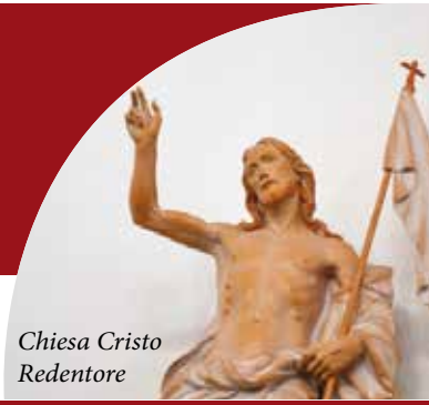
Chiesa Cristo Redentore

Moie, diocesi di Jesi (Pro manuscripto fuori commercio)